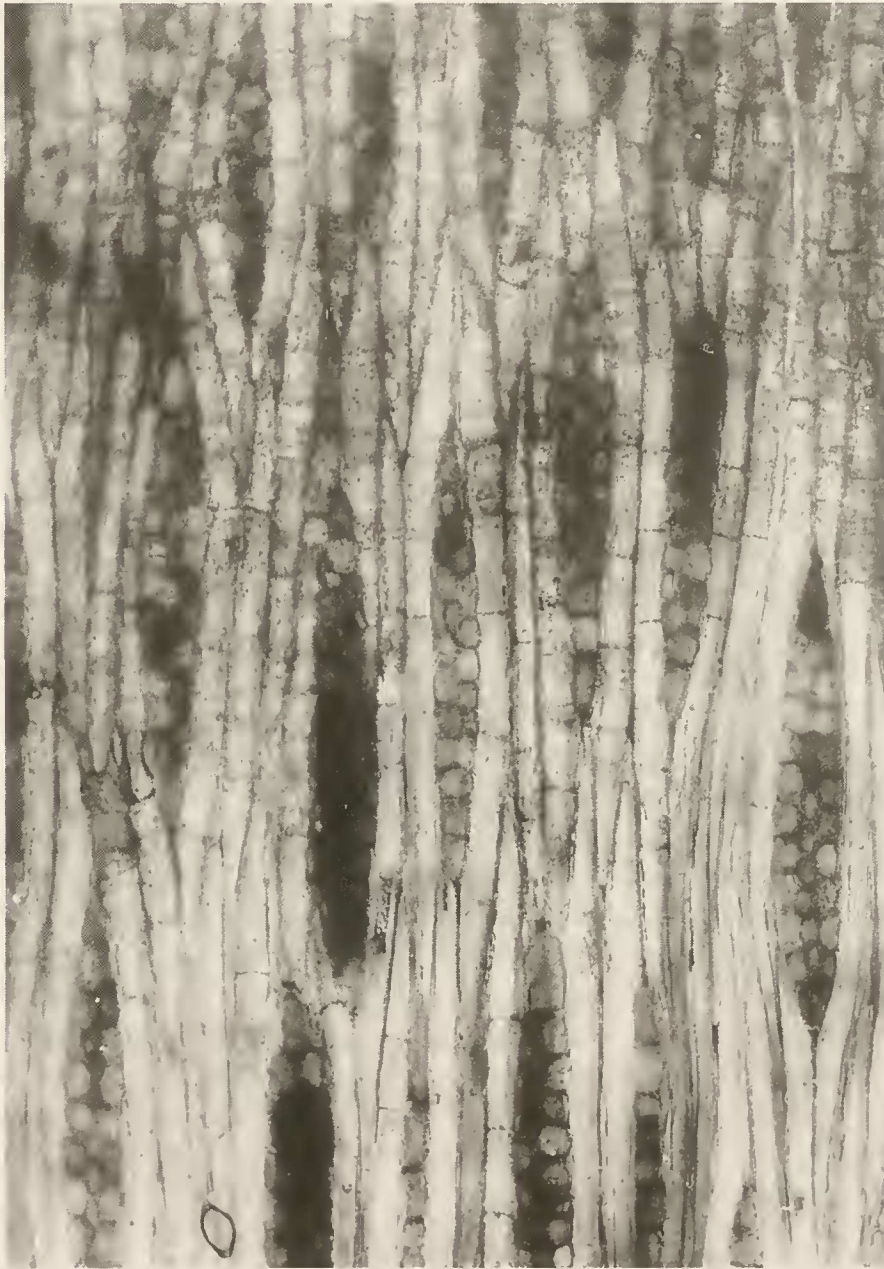
Abb. 7. Carapoxylon cf. xylocarpoides . Tangentialschliff. – Holzstrahlen mit Tendenz zu stockwerkartiger Anordnung, Faserzellen septiert; \times 100 .

Holzstrahlen 1-2-(3)-reihig, Tendenz zu stockwerkartiger Anordnung (IAWA list 1989; feature 122), Höhe der Holzstrahlen 210–530 \mu\text{m} , ein 1-reihiger Strahl z.B. 6 Zellen (220 \mu\text{m} ) hoch, ein 2-reihiger z. B. mit 11 Zellen (340 \mu\text{m} ), Höhe 2-reihiger Strahlen bis 510 \mu\text{m} , Holzstrahlzellen schwach heterozellular, liegende Zellen vertikal 19–25 \mu\text{m} hoch, Kantenzenellen bis 62 \mu\text{m} ; Holzstrahlzellen häufig mit dunklen, amorphen Massen angefüllt, mehrfach Holzstrahlzellen mit rhomboiden Einzelkristallen, Seitenlänge der Kristalle 12–14 \mu\text{m} ; 9–11 Strahlen je mm.